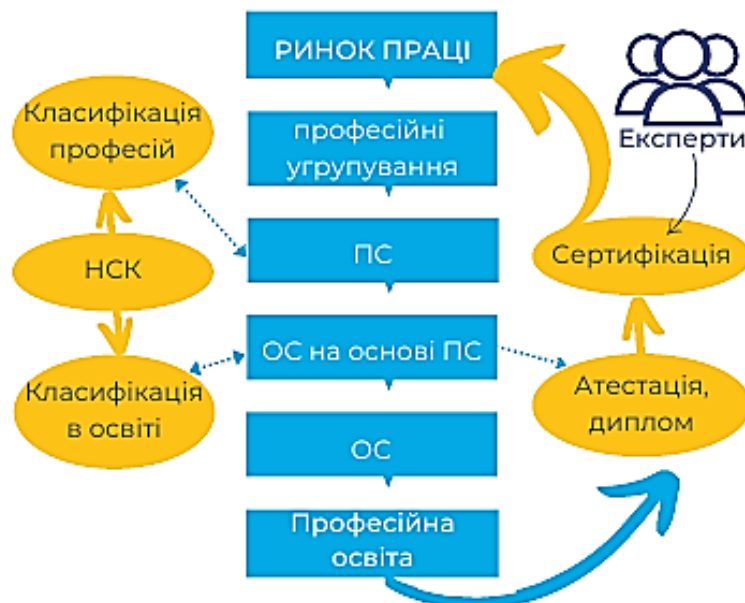
Рисунок 1 – Механізм взаємодії ринку праці та сфери освіти

Умовні позначення: ПС – професійний стандарт; ОС – освітній стандарт.