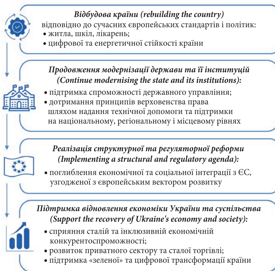
Рис. 3. Основні напрями реконструкції України (підхід Європейської Комісії) Джерело: складено авторами на основі Eur-Lex (2025). Communication from the Commission to the European Parliament, the European Council, the Council, the European Economic and Social Committee and the Committee of the Regions “Ukraine Relief and Reconstruction”. European Commission. Brussels, 18.5.2022. COM (2022) 233 final. https://eur-lex.europa.eu/legal-content/en/txt/?uri=celex:52022dc0233