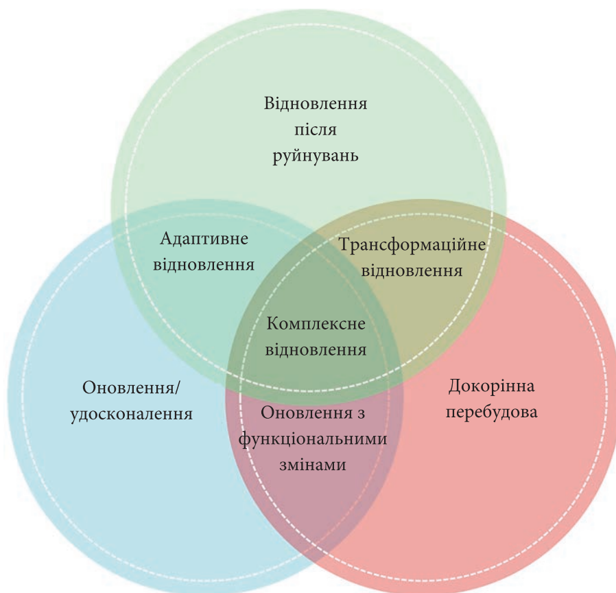
Рис. 2. Базові та комбіновані типи змін, які визначають сутність реконструкції

чення змінюються через нові умови суспільно-економічного розвитку. У цьому випадку можливі різні варіанти поєднання оновлення та докорінної перебудови. Наприклад, під час перебудови занедбаного промислового заводу чи вугільної шахти в науковий (технологічний) парк частина виробничих приміщень може бути збережена або осучаснена шляхом заміни обладнання, впровадження ресурсозберігаючих технологій та інших інноваційних рішень, а решта — набути нових функцій у вигляді офісів, лабораторій, бізнес-інкубаторів, що сприятиме розвитку технологій і підприємництва. Історичним прикладом такої реконструкції є науковий парк Рейн-Ельба в м. Гельзенкірхе (Німеччина), створений на базі занедбаного сталеливарного заводу. Цей проект був ініційований для диверсифікації економіки міста та Рурського регіону загалом, які не мали на той час (кінець 1980-х років) виразної наукової спрямованості. Завдяки спільним зусиллям та інвестиціям Європейського Союзу, землі Північна Рейн-Вестфалія та компанії RWE Energy